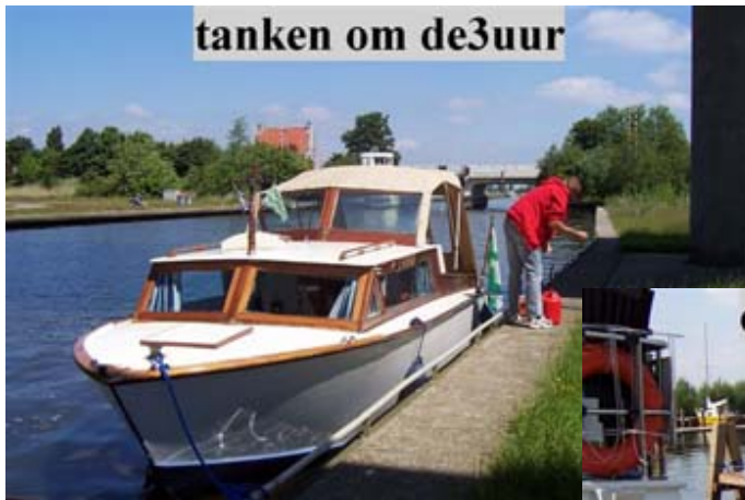
tanken om de3uur